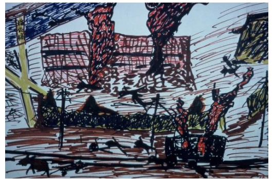
原爆の炸裂により、火災を起こす工場と周辺を走っていた電車の状態