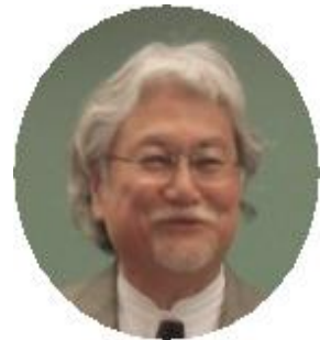
非核の政府を求める 石川の会代表世話人