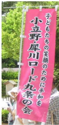
小立野・厚川ロード九条の会・のぼり旗

第一の矢・大胆な金融緩和と政策 金融政策。第二の矢・機能的な財政政策 公共事業政策。第三の矢・民間投資