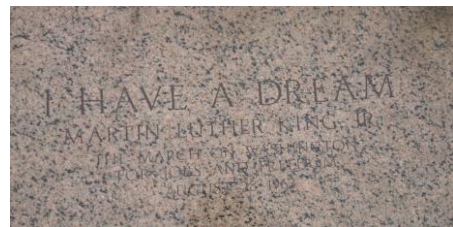
(写真上) リンカーン記念堂の演説の場からジョージ・ワシントン記念塔を臨む (写真下) 演説「I HAVE A DREAM」の場所であることが刻まれている