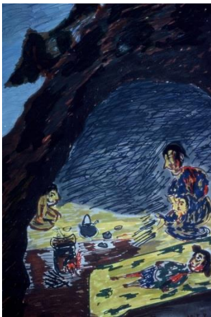
長崎投下五日後の状態 長崎市井樋口町 電車の停留所附近の防空壕の中で