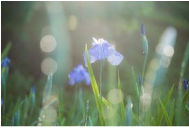
朝日の中で輝く花菖蒲＝金沢市・卯辰山花菖蒲園

いずれにしても温度・湿度ともに変化が大きい時期ですので、みなさま体調管理にはぜひお気を付けください。